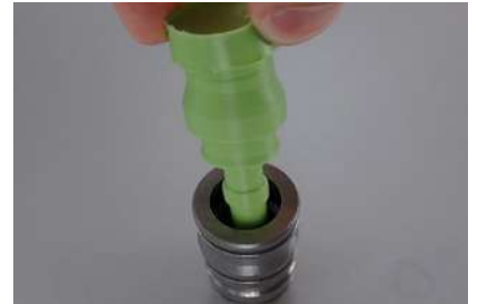
Mesure dimensionnelle interne