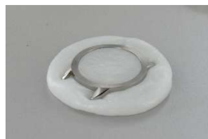
Maintien de pièces, bridage, renfort