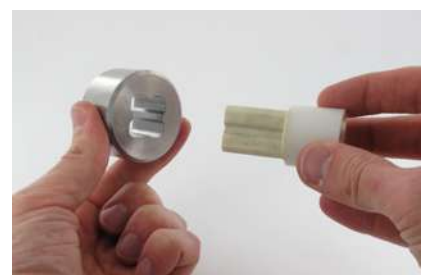
Bouchon de protection