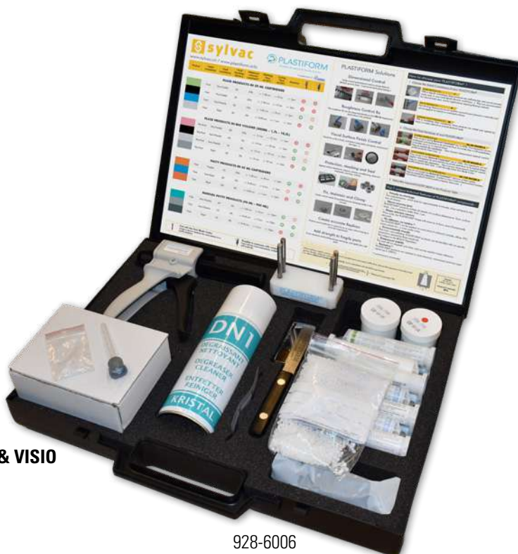
Kit spécial SCAN & VISIO