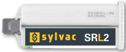
Cartouches 50ml et 400ml