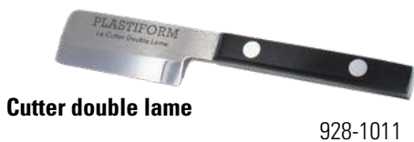
Cutter double lame