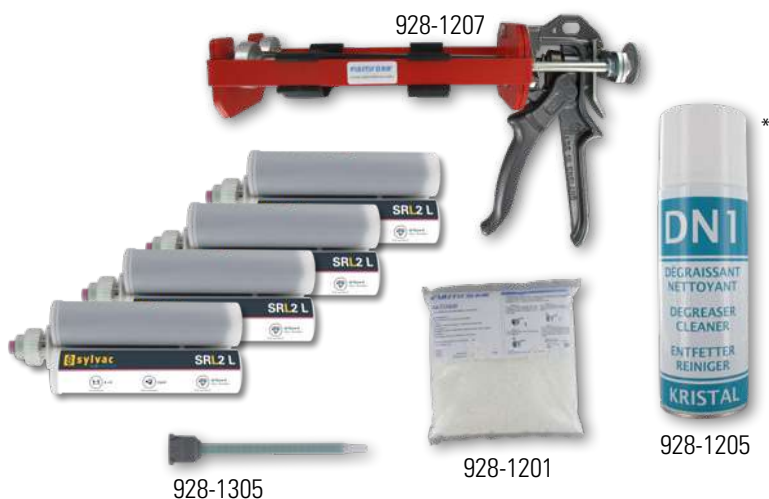
Exemple de contenu d'un kit grand volume (928-5001)