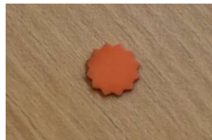
Découpe du profil de la pièce