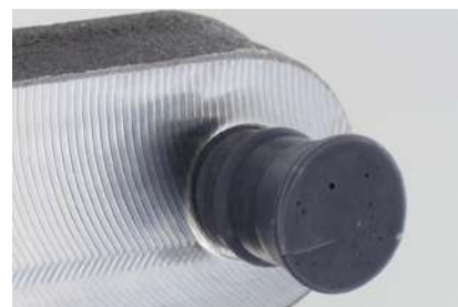
Protection, masquage, étanchéité