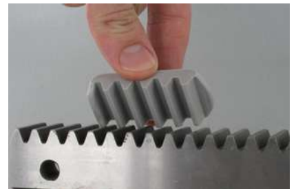
Mesure dimensionnelle externe