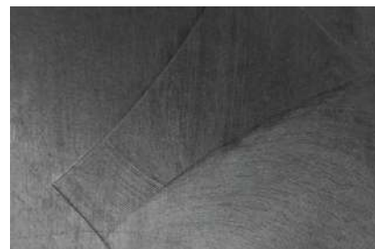
Contrôle de l'état de surface