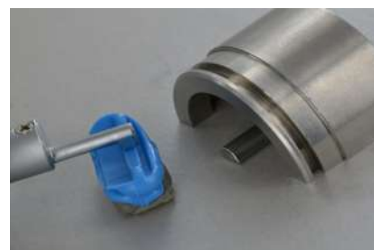
Contrôle de rugosité Ra